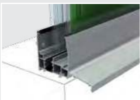
DETALIU PROFIL BAZĂ Profil de bază completat cu barieră termică și picurător