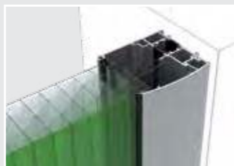
DETALIU PROFIL LATERAL Profil lateral cu barieră termică