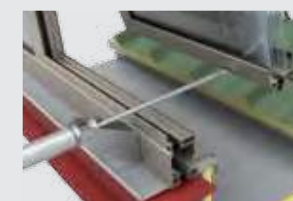
DETALIU SISTEM DE DESCHIDERE Noile profile de aluminiu cu barieră termică permit crearea de cadre care se deschid pentru ventilația ferestrelor continue.