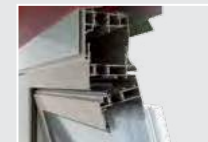
PROFILE CU BARIERĂ TERMICĂ Utilizarea noilor profile cu barieră termică garantează o etanșare perfectă împotriva agenților atmosferici prin evitarea disipării căldurii.